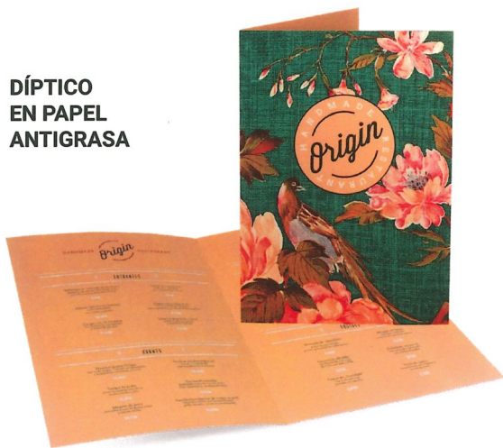
DÍPTICO EN PAPEL ANTIGRASA