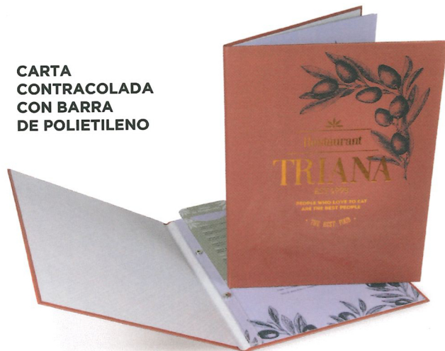
CARTA CONTRACOLADA CON BARRA DE POLIETILENO