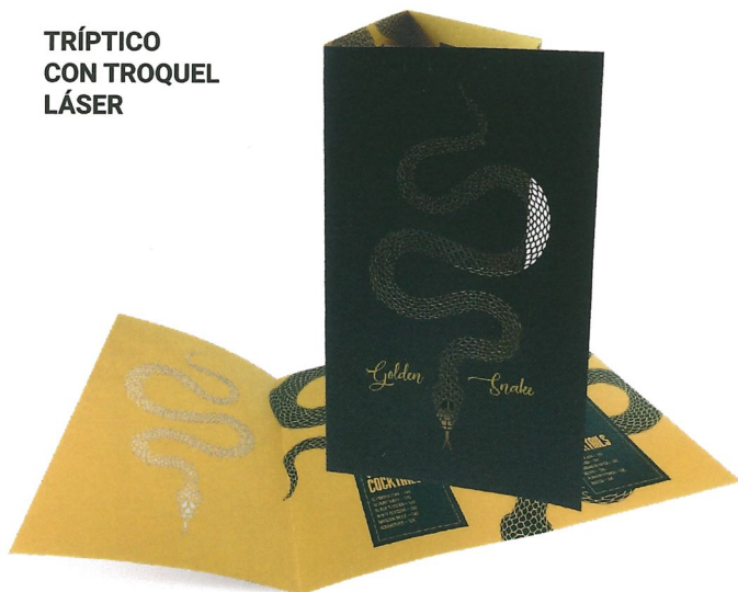
TRÍPTICO CON TROQUEL LÁSER