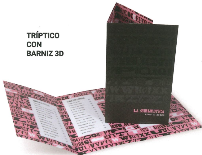
TRÍPTICO CON BARNIZ 3D